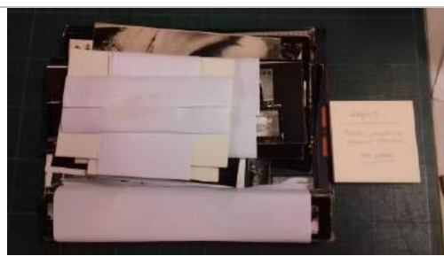
Conjunto de positivos previa intervención