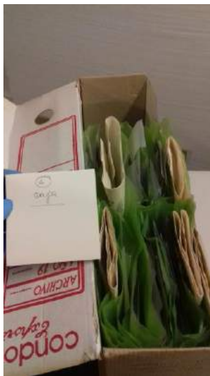
Caja con fotografías y negativos en bolsas