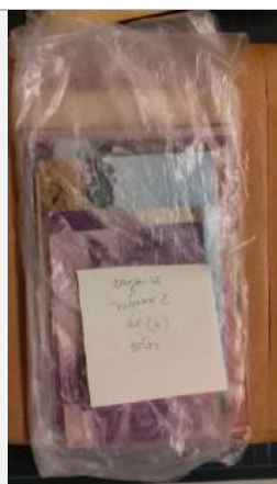
Contenedores transitorios sin PVC