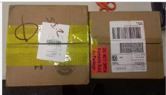
Vista parcial de la llegada de las cajas con sobre especiales