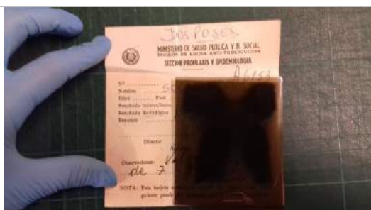
Caso de radiografía con informe