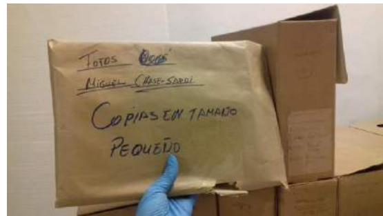
Sobre con fotografías