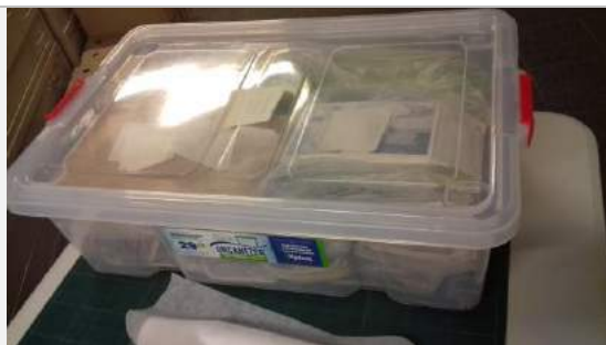
Uno de los contenedores transitorios