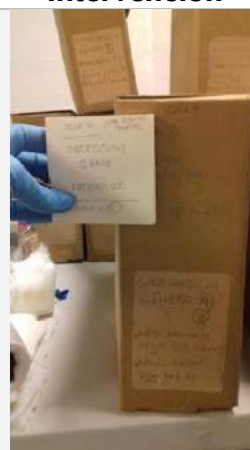
Etiqueta con datos de referencia