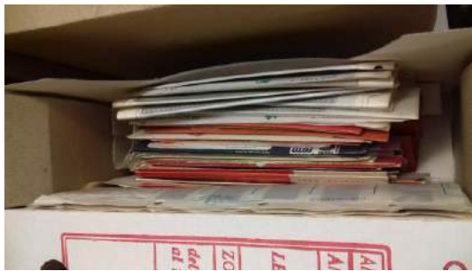
Una de las cajas con los materiales