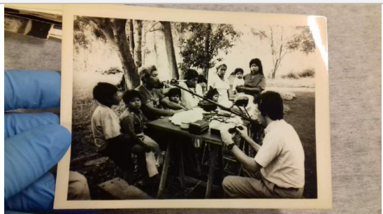
Antes de la guarda