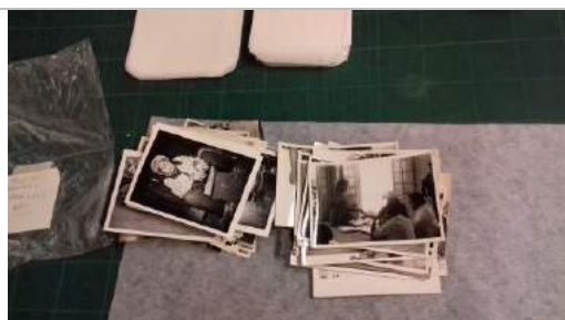
Conjunto de positivos y sobres