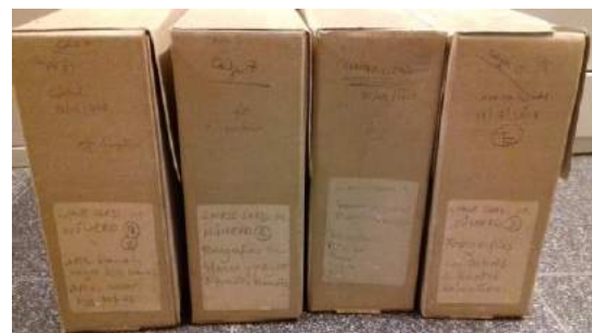
Etiquetas con textos de Chase-Sardi.