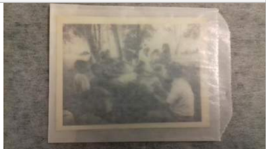
Vista de una fotografía en sobre