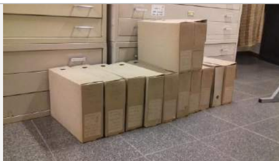
Conjunto de cajas seleccionadas