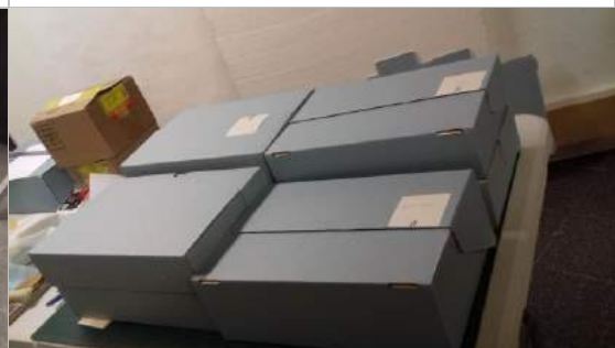
Ubicación definitiva de la selección en cajas especiales.