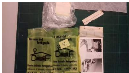
Conjunto de positivos y sobre con negativos