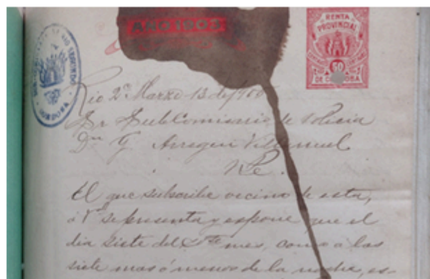
Detalles representativos de las alteraciones detectadas en los soportes.