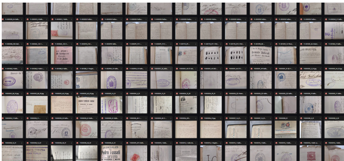
Captura de pantalla: registro visual

Se realizó un registro fotográfico de elementos clave en los tomos, alcanzando un 100% la meta establecida. Este registro documenta elementos de valor como marcas de agua en soportes de papel artesanal, sellos de juzgados, firmas de autoridades locales y tipologías de encuadernación. Estas imágenes generadas constituyen una herramienta para el estudio de la materialidad del documento y actúa como testigo del estado de conservación previo a las intervención para la estabilización de los tomos. Para garantizar el control y la trazabilidad de este proceso, cada unidad cuenta con su respectiva Ficha de Identificación (ID) por tomo.