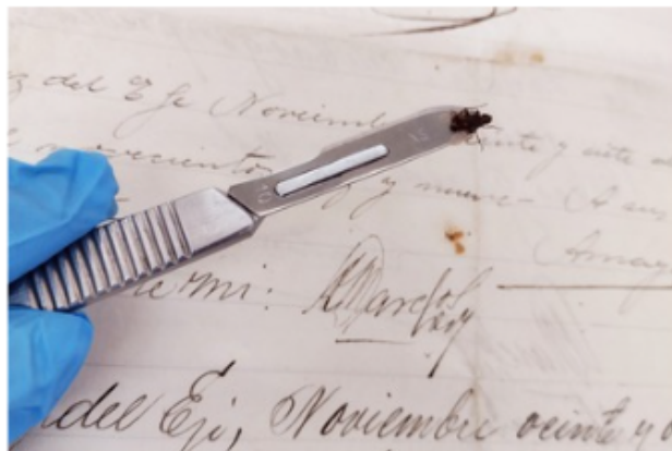
Detalles representativos de tratamiento y estabilización