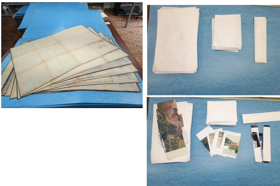
Ilustración 2: Documentación almacenada tras la intervención

Esta situación fue subsanada mediante la intervención realizada a la colección. En este proceso, la totalidad de los planos y documentos gráficos fueron realmacenados en carpetas desacidificadas de gran formato. Asimismo, las fotografías se dispusieron en sobres especiales y la documentación de menor tamaño fue almacenada en cajas X-100, retirándose en su totalidad el material abrasivo identificado.