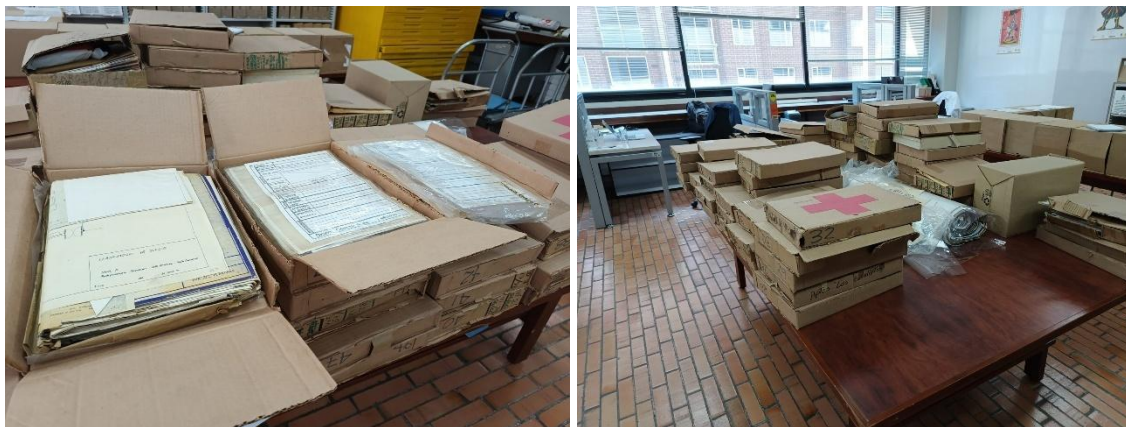
Ilustración 1: Estado de almacenamiento al iniciar la intervención

Explicación de la actividad: Al inicio de la intervención, la colección no se encontraba en condiciones adecuadas de almacenamiento. La mayor parte de la documentación estaba dispuesta en cajas especiales no estandarizadas para uso archivístico y, en su interior, se encontraba organizada en paquetes o bolsas plásticas. Los planos y demás documentos en gran formato se hallaban doblados, lo que incrementaba el riesgo de deterioro físico. De igual forma, se encontraron una gran cantidad de ganchos y material abrasivo al momento del levantamiento del inventario.